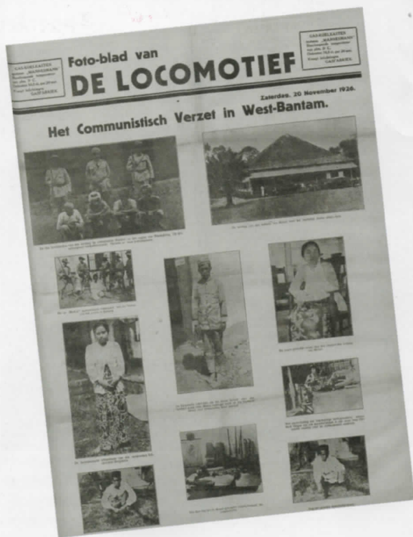
Dagblad De Locomotief brengt de communistische opstand in beeld.

↘ rivier, werken als verpleger. Het kamp kent een school en voetbalveld, het Wilhelmina-ziekenhuis, een gevangenis, kerk en kerkhof.